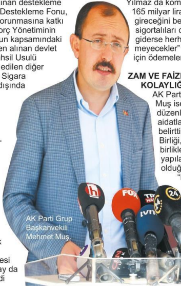
AK Parti Grup Başkanvekili Mehmet Muş

AK Parti Grup Başkanvekili Mehmet Muş ise gündüz saatlerinde düzenlediği basın toplantısında aidaatların da kapsama alındığını belirtti. TOBB, TESK, Barolar Birliği, TÜRMÖB, ihracatçı birliklerinin aidaat ödemelerinin yapılandırma kapsamında olduğunu dile getiren Muş, "Emlak vergisi, Çevre Temizlik Vergisi, İlan ve Reklam Vergisi, diğer vergi ve harçlar, su, atık su, katı atık ücretleri, yol katılım payları, muhtelif ücretlerden kaynaklı kurum alacakları ve zam ile faizleri de yapılandırma kapsamına alıyoruz" diye konuştu.